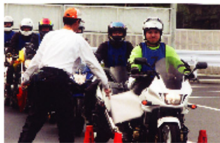
実技テストの様相

交通部、二輪車安全普及協会の協力を得て、10月22日(土)に二輪車安全運転指導員資格審査を実施しました。