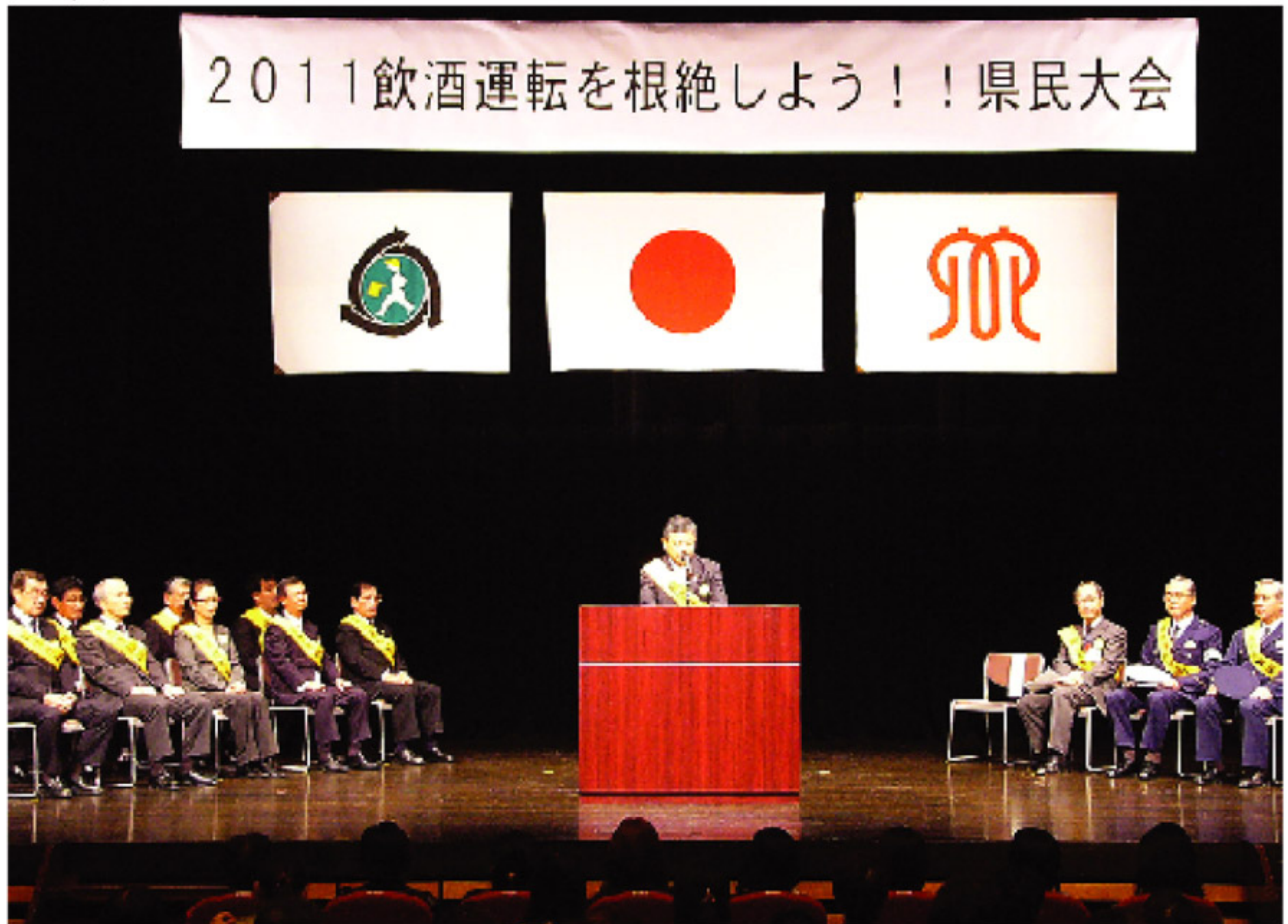
(2011「飲酒運転を根絶しよう!! 県民大会」i磯子)