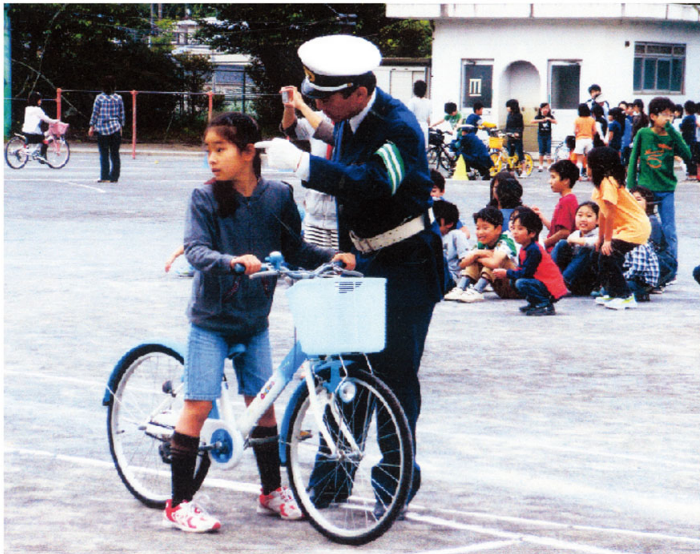
(戸塚交通安全協会)