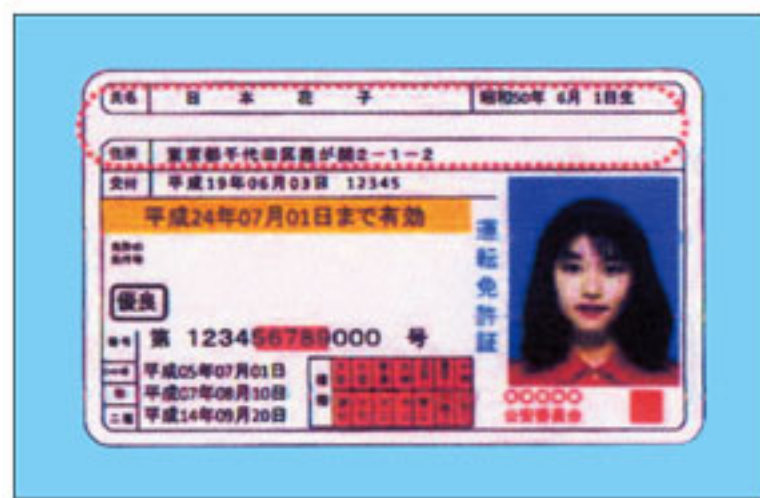
▲ 表面 ▼ 裏面