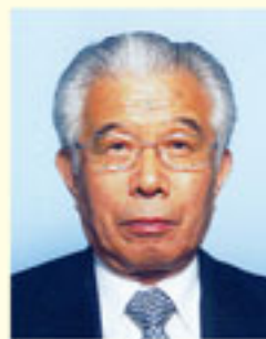
高津交通安全協会 会長